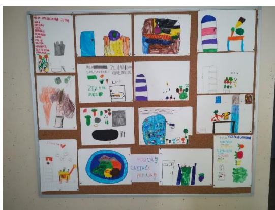
Pozor! Cvetača prihaja!

V oddelku podaljšanega bivanja smo v sklopu projekta Erasmus+ učence spodbujali k branju. Najprej je na obisk prišla knjiga Pozor! Cvetača prihaja! s katero smo učence ozaveščali tudi o pomenu zdrave prehrane. Naše aktivnosti so se nadaljevale z adventnim branjem, ko smo vsak dan do božiča odvili eno knjigo in jo prebrali. Z dejavnostjo S pravljico po Sloveniji smo potovali po Sloveniji in spoznavali njene znamenitosti. Z dramsko igro pa smo ob slovenskem kulturnem prazniku uprizorili tudi pesnitev našega največjega pesnika Franceta Prešerna, Turjaško Rozamundo.