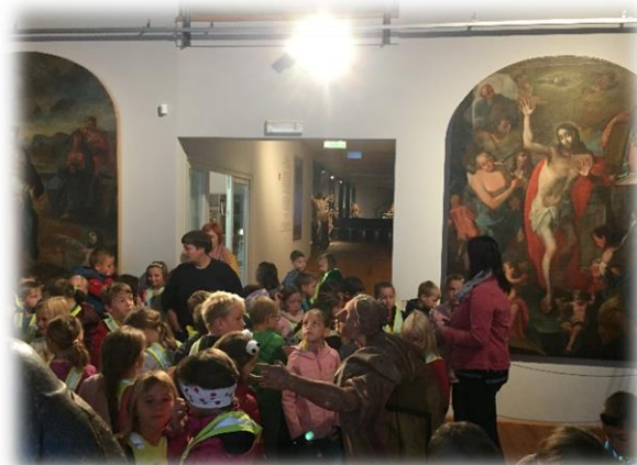
Z velikim zanimanjem smo prisluhnili anekdotam ge. Vlaste v Muzeju baroka Šmarje.

Skoraj vsi so osvojili priznanja za bralno značko, nekaj manj učencev si je prislužilo priznanje eko bralne značke. Želeli bi si, da bi teh učencev bilo še več, saj je branje veščina, na kateri temelji večina ocenjenega znanja. Skozi leto so učenci lahko obiskovali naslednje interesne dejavnosti: folklor, med dvema ognjema, košarka za deklice, atletika, pevski zbor, joga, šah in urice za bistre glave. Pri slednji so se učenci pripravljali na razna tekmovanja: Logična pošast, Matemček in naravoslovno tekmovanje Kresnička. Ostala tekmovanja so bila zaradi epidemije odpovedana.