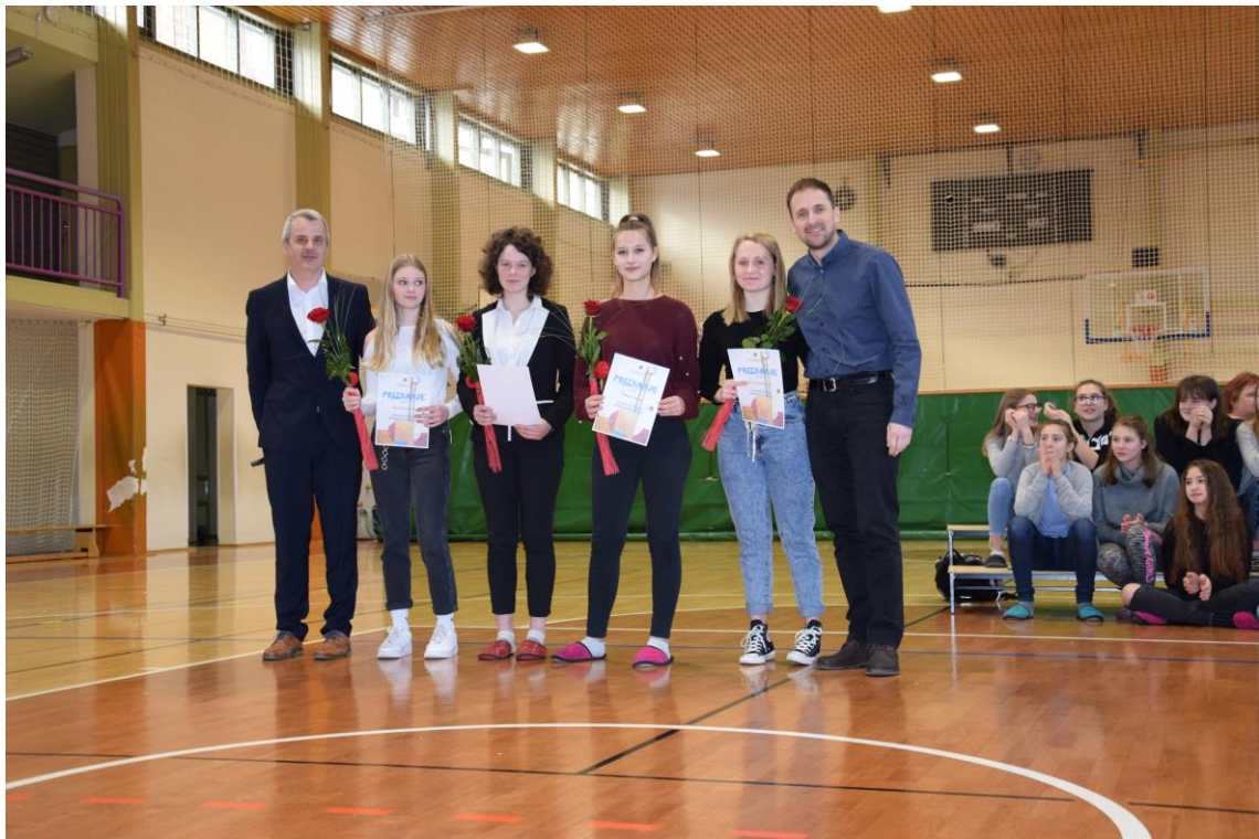
Najkulturnice ob prevzemu priznanja