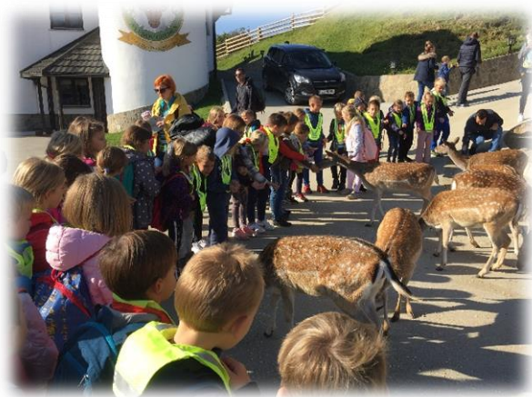
Na Jelenovem grebenu.

Vsekakor pouk na daljavo ni pouk, kot smo ga navajeni. Zato smo čas, ko smo se ponovno vrnili v šolske klopi, namenili predvsem utrjevanju in poglobljanju minule snovi. Čeprav 'na razdalji' je v razredu spet bilo slišati smeh, otroško razigranost in željo po novem znanju.