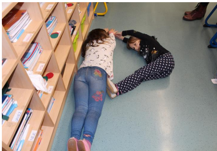
Pisanje črk s telesi

Ob koncu leta smo priredili piknik na šolskem igrišču in se poslovili od petošolcev.