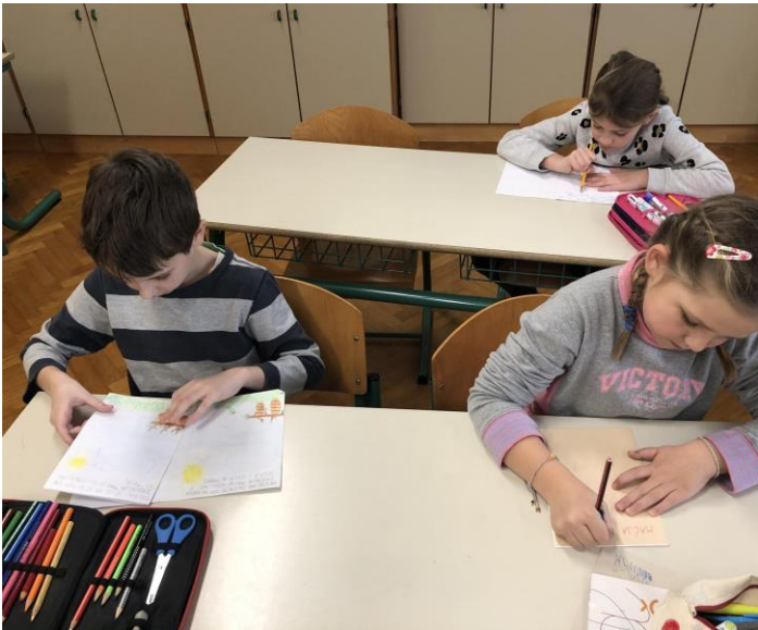
Drugošolci avtorji in ilustratorji lastnih knjig