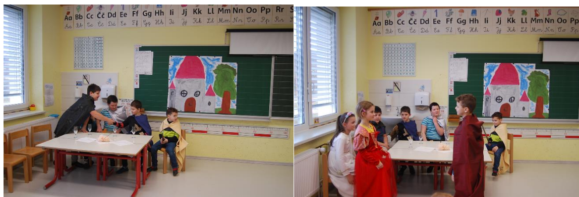
Dramatizacija Turjaške Rozamunde

Vesele, sproščene in razgibane počitnice vam želimo!