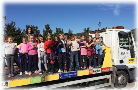
Ogled intervencijskih vozil je vedno težko pričakovan dan.

Dve leti skupnega druženja je za nami. Spoznali smo tiskano in pisano abecedo, urili lep in pravilen zapis črk, (z)brali, pripovedovali, deklamirali ter uživali ob likovnem in glasbenem ustvarjanju. Seveda pa je bila težko pričakovana ura pouka vedno šport. In pa glavni odmor ... druženje in igra na prostem je zanje še kako pomembna. Pridobili so znanja, spretnosti in veščine, pomembne za življenje.