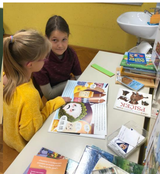
Skupno branje poučnih knjig