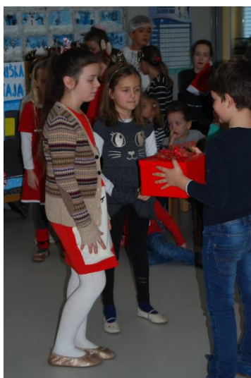
Proslava ob dnevu reformacije