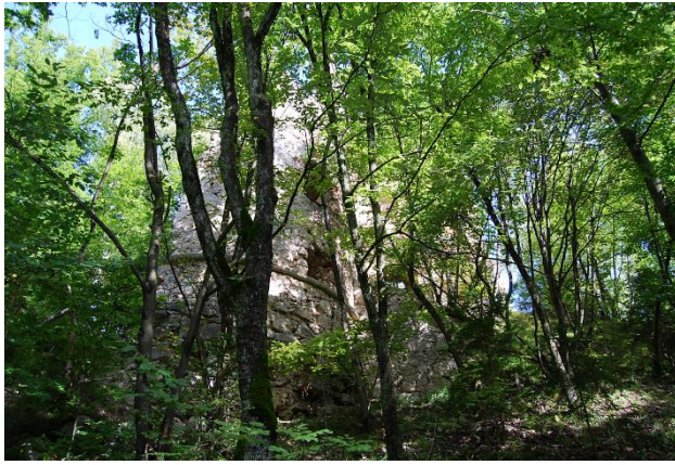
Zaraščene ruševine Žusemskega gradu