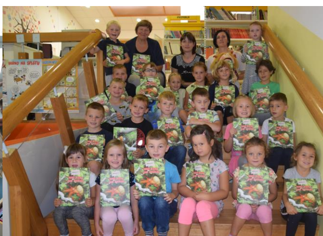
1.c ob prejemu darilnih slikanic