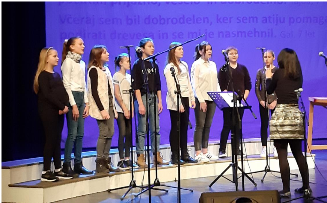
Vokalna skupina na Karitasovi dobrodelni prireditvi