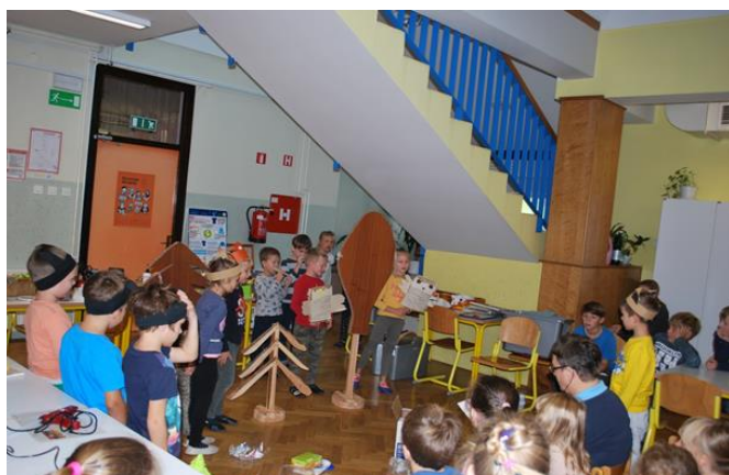
Predstavili smo se z EKO igrico