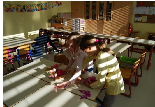
Pravica do igre