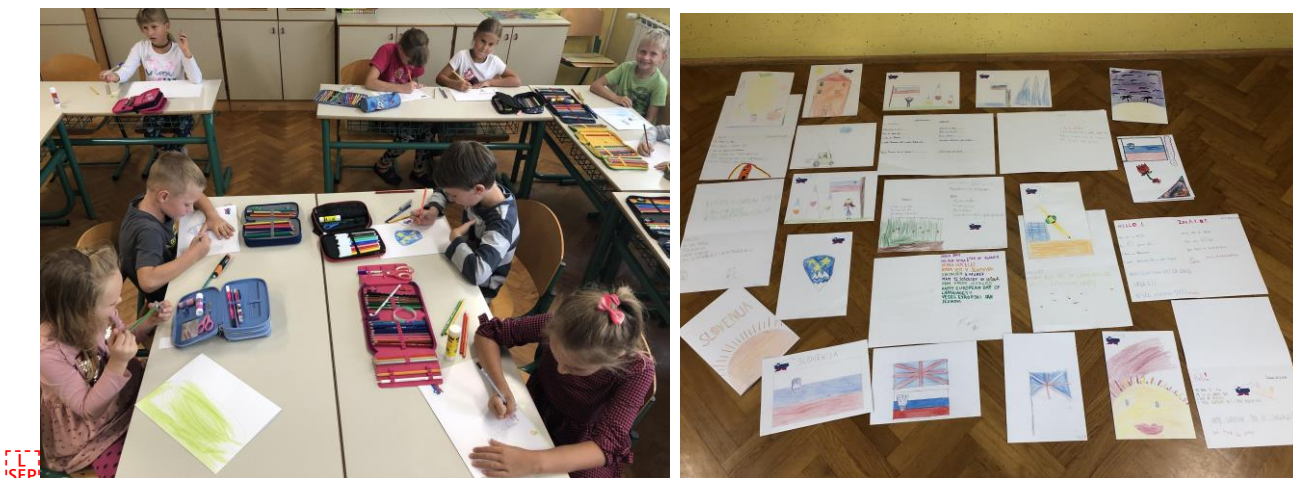
Pisanje voščilnic ob evropskem dnevu jezikov

Na šoli Šmarje pri Jelšah in podružnicah deluje projektni tim učiteljev, ki se zaveza za digitalno tehnologijo podprto pedagoško prakso, ob tem pa skrbi za varnost na spletu, uvedbo inovativnih in kreativnih pedagoških pristopov, spodbuja stalno strokovno spopolnjevanje šolskega osebja in sodelovalnega dela med učitelji in učenci. Projekti in aktivnosti eTwinning predstavljajo znotraj institucije način dela v okviru rednih šolskih obveznosti. Tako smo letos pri pouku, neobveznem izbirnem predmetu nemščina in podaljšanem bivanju sodelovali v projektu European Day of Languages, kjer smo si izmenjali voščilnice z drugimi državami. Učenci so spoznali platformo Twinspace in si med sabo dopisovali.