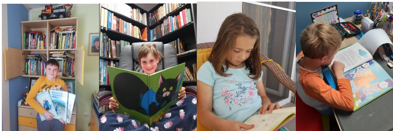
Naši pridni bralci v času poučevanja na daljavo

April, mesec knjige, smo obeležili na daljavo. Učenci so lahko prebrali poslanico ob mednarodnem dnevu knjig za otroke in si ogledali plakat, spodbujali smo jih k reševanju knjižnih ugank in kviza o Andersenu. V času razglašene epidemije so pošiljali fotografije in zapise, kako preživljajo čas s knjigo.