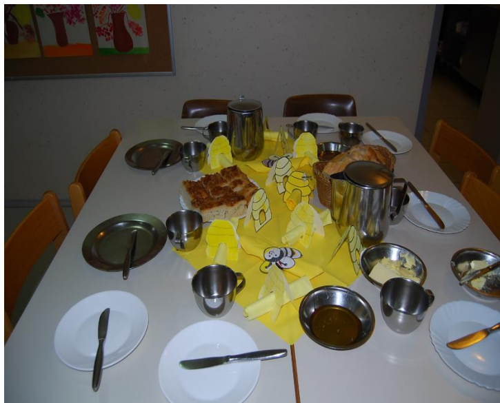
Sajenje dreves v okolici šole in tradicionalni slovenski zajtrk