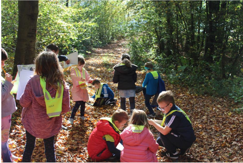
Raziskovanje jesenskega gozda