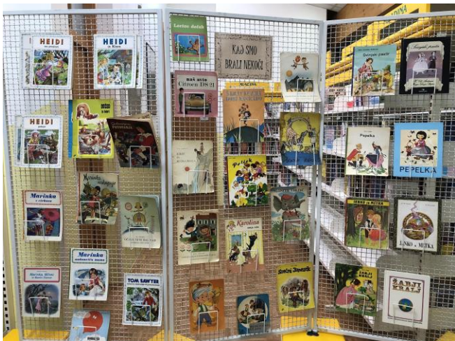
Razstava v knjižnici "Kaj smo brali nekoč"