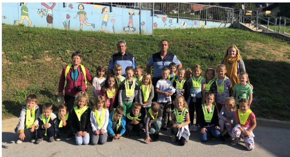
Tehniški dan in sodelovanje ter predstavitev policistov