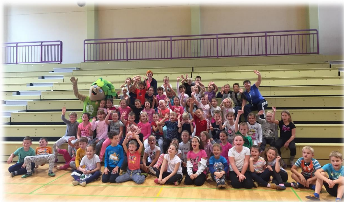
Lipko, igriva košarka in mi. Nasmejani in prijetno utrujeni po zabavnem športanju.

Vsekakor pouk na daljavo ni pouk, kot smo ga navajeni. Zato smo čas, ko smo se ponovno vrnili v šolske klopi, namenili predvsem utrjevanju in poglobljanju minule snovi. Čeprav 'na razdalji' je v razredu spet bilo slišati smeh, otroško razigranost in željo po novem znanju.