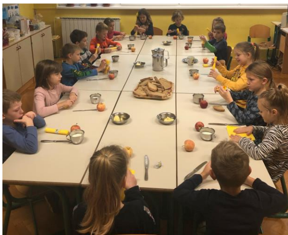
Slovenski tradicionalni zajtrk