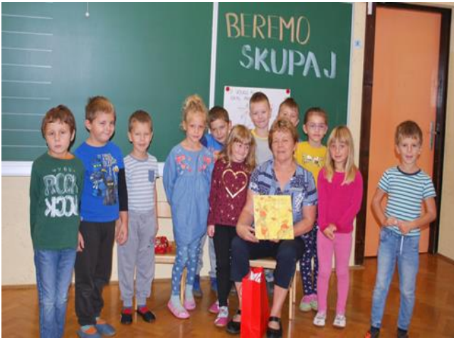
Babica nam bere