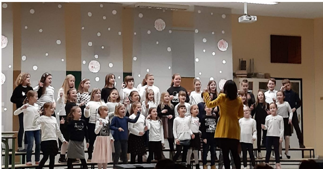
Razigrani pevci in pevke na Koncertu šolskih pevskih zborov