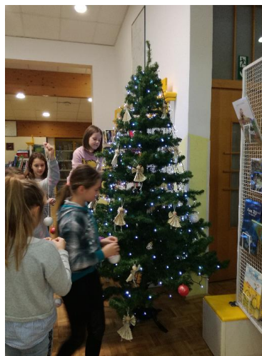
Praznični december v knjižnici