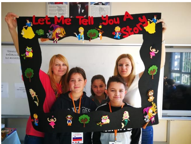
Prva mobilnost v Turčiji