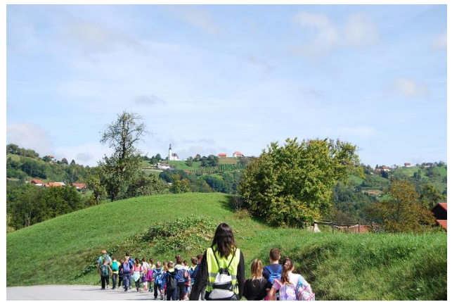
Pogled na Babno Goro