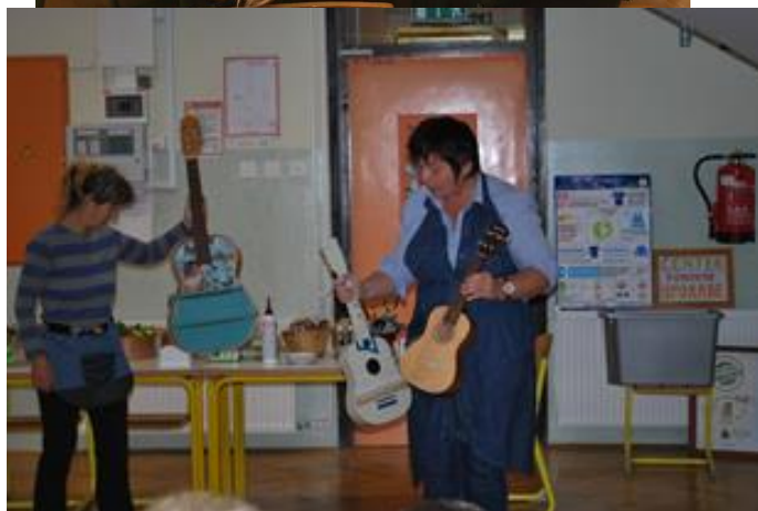
Ekodan v sodelovanju s Centrom ponovne uporabe