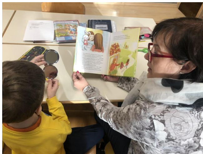
Logopedske vaje s pomočjo pravljice