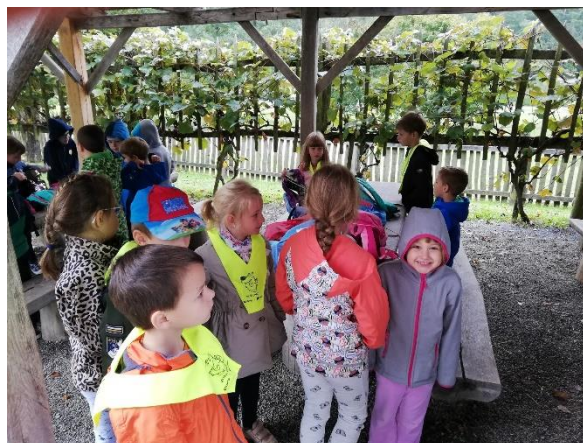
Naravoslovni dan v Rogatcu

Dobro smo sodelovali tudi s šolsko knjižnico. Knjižničarki sta obiskali nas, mi pa smo se tudi oglasili v knjižnici, ko smo se mudili na centralni šoli.