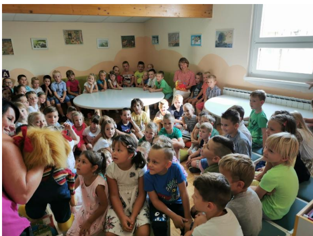
Pravljica na prvi šolski dan

Prvošolčkom smo pripravili sprejem s pravljico. 17. septembra smo obeležili dan zlatih knjig in jim podelili darilne slikanice Škrat Kuzma dobi nagrado avtorice Svetlane Makarovič in ilustratorja Tomaža Lavriča . Decembra so med knjigami ob pravljici priklicali dedka Mraza. V sodelovanju z vrtcem smo v knjižnico povabili bodoče prvošolčke, različne starostne skupine so prihajale tudi med letom ali pa jih je knjižničarka obiskala na podružničnih šolah in v vrtcu.