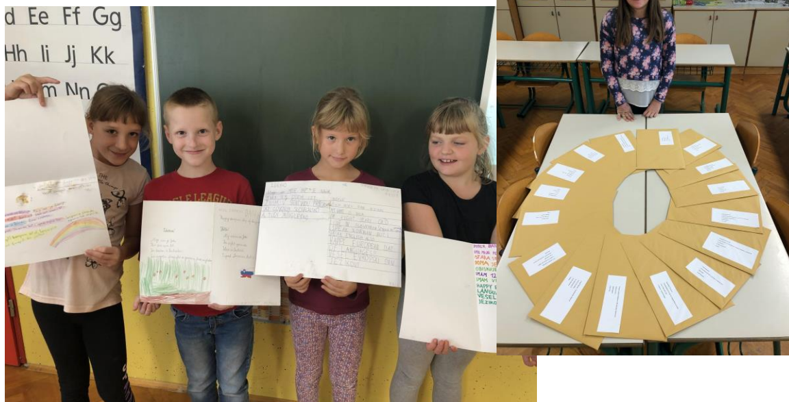
Pisanje voščilnic v druge države ob evropskem dnevu jezikov