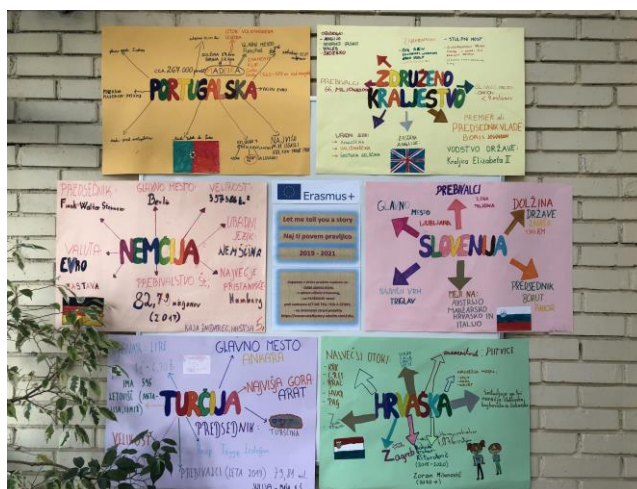
Raziskovanje o sodelujočih državah pri Erasmus+ projektu in urejen kotiček