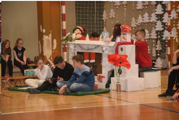
Razmišljanje o vrednotah v času praznikov