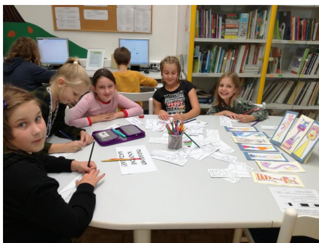
Izdelovanje barvitih knjižnih kazalk