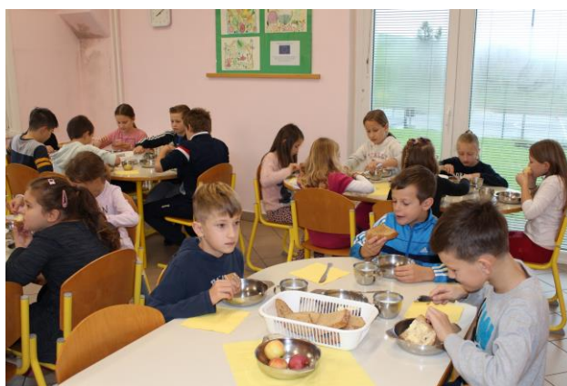
Slovenski tradicionalni zajtrk