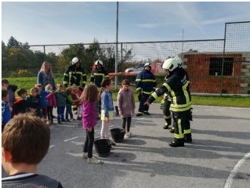
Obisk gasilcev v tednu otroka