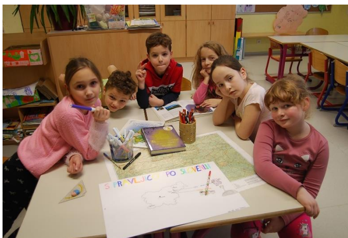
S pravljico po Sloveniji