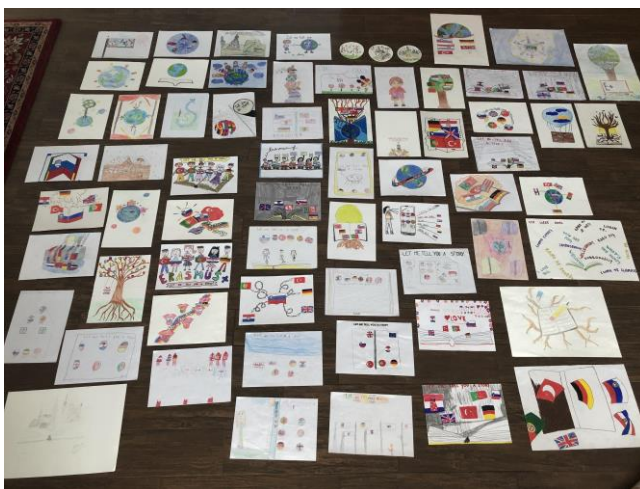
Risanje logov za projekt