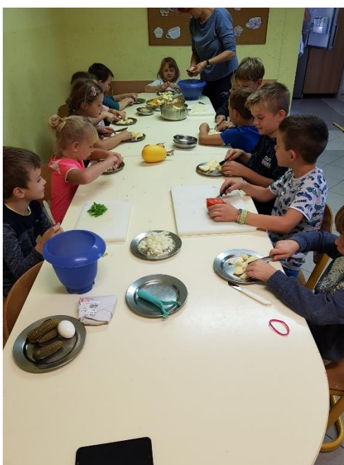
Kuharske delavnice v tednu otroka

OTROŠKI PEVSKI ZBOR na Sladki Gori je letos obiskovalo 11 učencev od 1. do 4. razreda. Družili smo se ob četrtnih pred poukom in petkih po pouku. Razvijali smo melodični in ritmični posluš, se učili pravilno dihati, se posvetili petju umetnih pesmic in pesmicam ljudskega izvora. S pesmijo smo letos popestrili kar nekaj dogodkov v šoli. Zapeli smo tudi dedku Mrazu in krajanom ob otvoritvi nove ceste. Skupaj z otroškim pevskim zborom iz Mestinja smo se