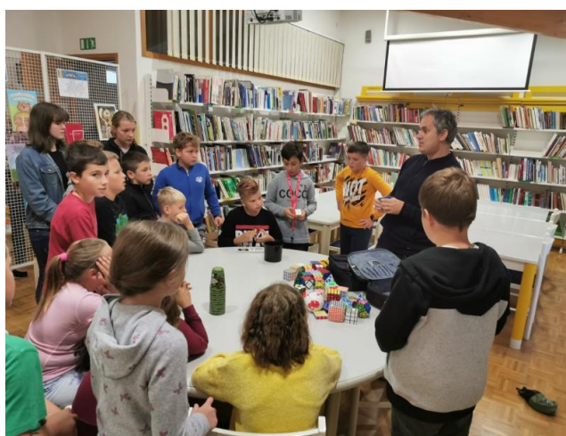
Sestavljanje rubikovih kock

Prav tako so učenci pridno reševali knjižne uganke , vezane na temo tedna otroka – otrokove pravice. Posebno pozornost smo v drugi polovici oktobra namenili spominu na obdobje reformacije . Z razstavo faksimiliranih izdaj pomembnejših del slovenskih protestantskih piscev smo učencem približali pomen tega obdobja za nas, Slovence. Privabljala je še ena razstava: Pravljični svetovi Svetlane Makarovič in Jelke Reichman.