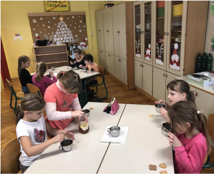
Čajanka z domačim čajem, limono, medom in piškoti