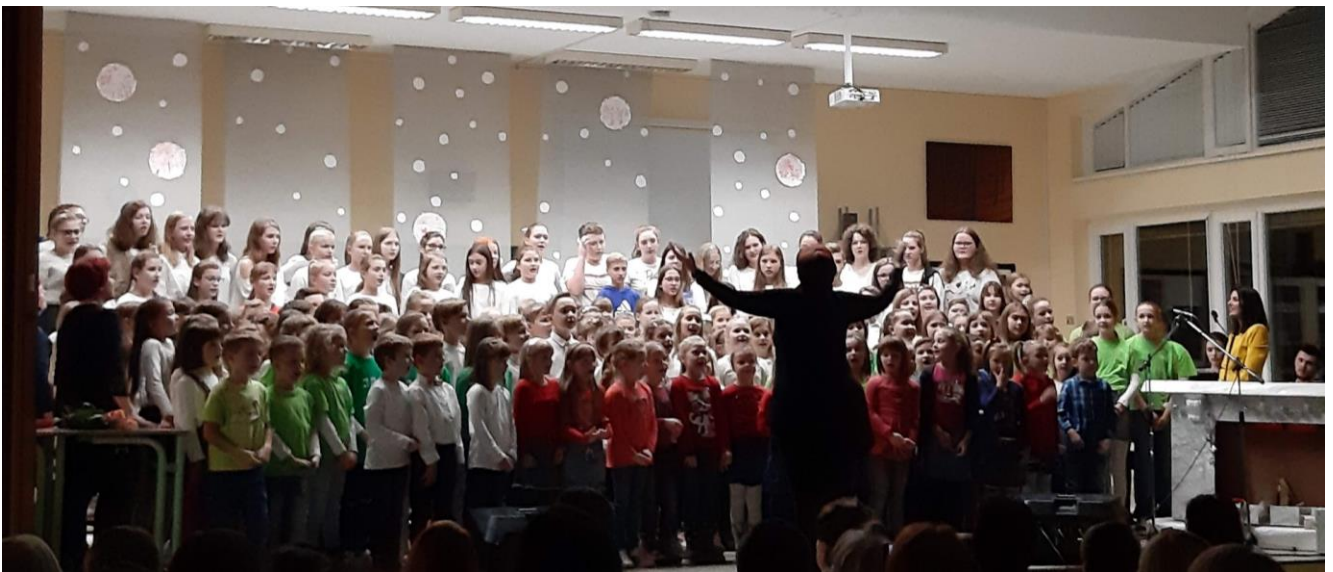
Združeni zbori na Koncertu šolskih pevskih zborov

16. januarja smo pripravile tradicionalni koncert zborov centralne šole in podružnic. Območne revije ni bilo, v zadnjem času so bile odpovedane tudi skupne vaje. Na spletni strani šole je bilo sicer dostopno tudi gradivo za delo na daljavo, a vsekakor se veselimo, da bodo otroški glasovi ponovno zazveneli skupaj v živo.