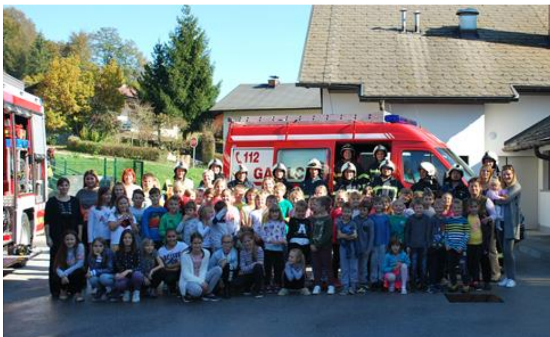
Uspešno izvedena požarna vaja