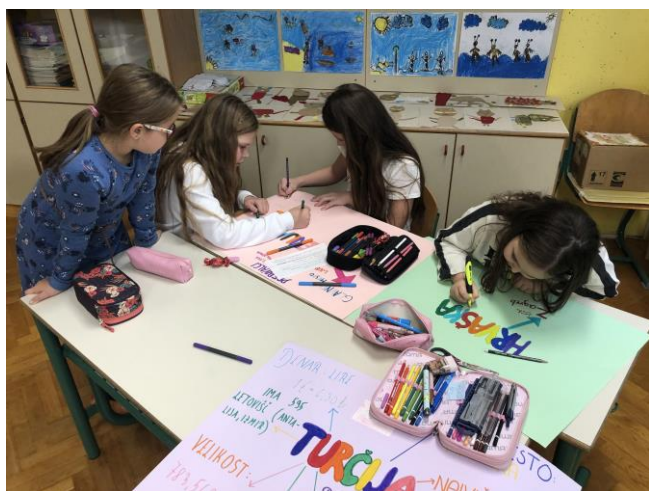
Spoznavanje partnerskih držav in pisanje plakatov

Vse zgoraj naštetе raznovrstne aktivnosti ne bi bile mogoče brez strokovnih delavcev, ki sodelujejo pri projektu. Z veliko volje so pri projektu angažirani tako predmetni kot razredni učitelji centralne šole in podružničnih šol, vzgojitelji, knjižničarki, svetovalna služba, računovodkinja in vodstvo šole, ki projekt podpira. Zagotovo to usklajenost čutijo tudi učenci, ki z veseljem sodelujejo v projektu.