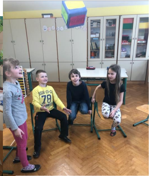
Pogovor o vrednotah